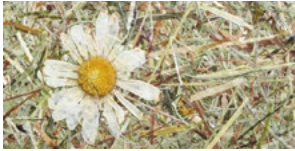
WILDSPITZE MARGERITTA* ALMHEU MIT MARGERITEN