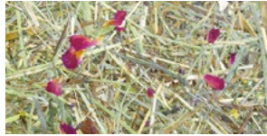
WILDSPITZE ROASA* ALMHEU MIT ROSENBLÜTEN