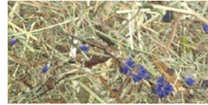
WILDSPITZE LAWENDL* ALMHEU MIT LAVENDEL