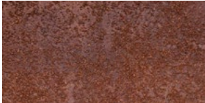
ROSCHT FEIN GEMAHLENE RINDE