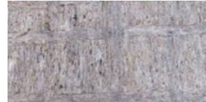
WOLLÄ WOLLE VOM TIROLER BERGSCHAF