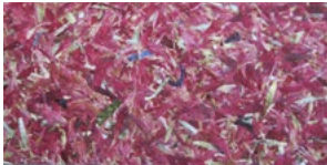
KORNBLUAMA ROAT* KORNBLUMEN BLÜTENBLÄTTER ROT