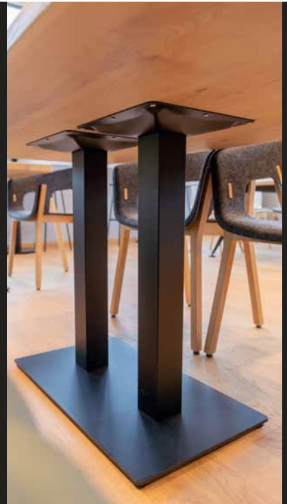
Gestell Modell Gastro Metall massiv Duo