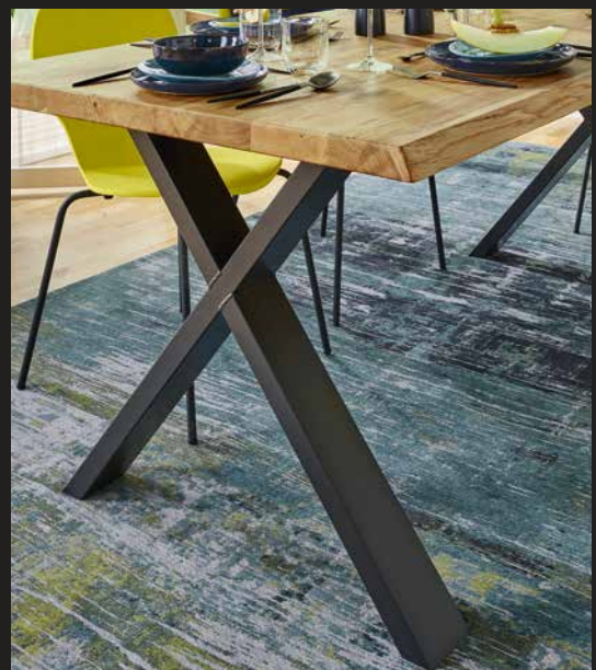
Gestell Modell Metall filigran