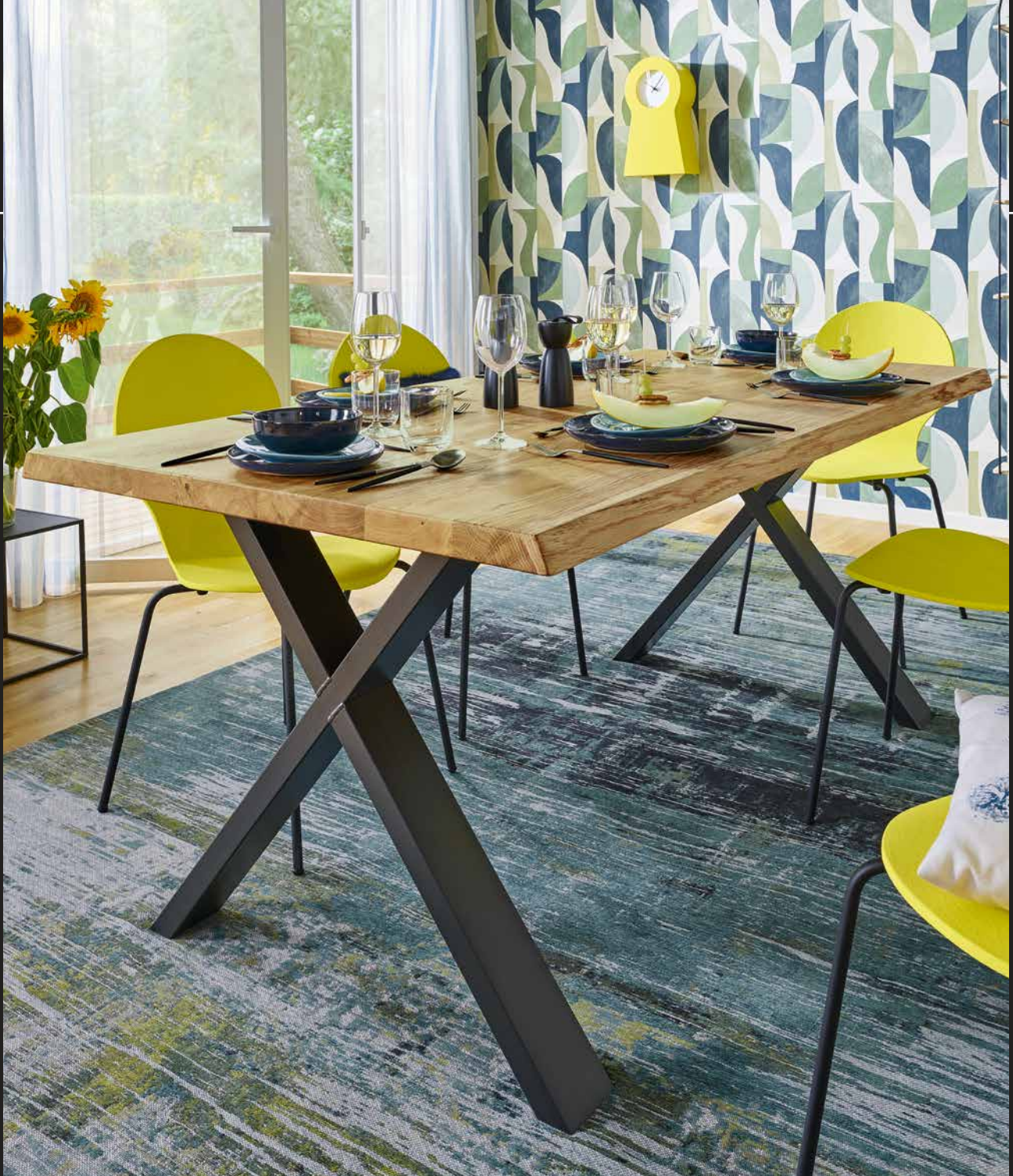
Tischplatte Eiche Modell I | Gestell Modell Metall filigran