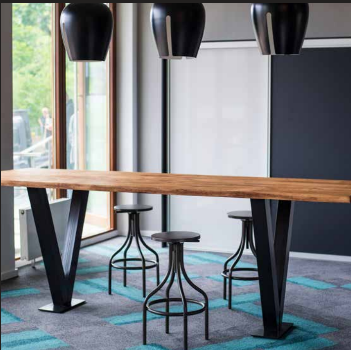
Gestell Modell Stehtisch Metall massiv V