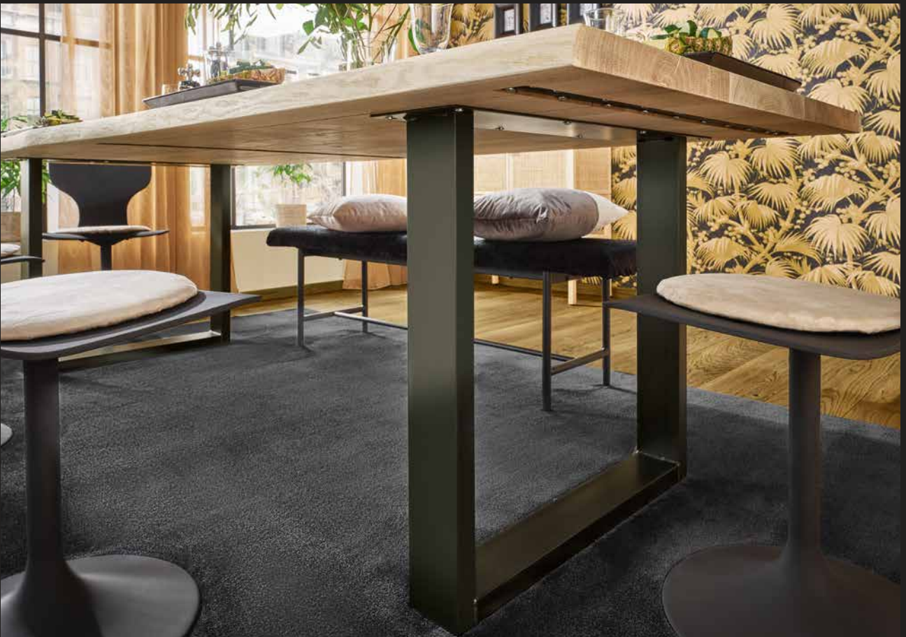
Gestell Modell Metall filigran U