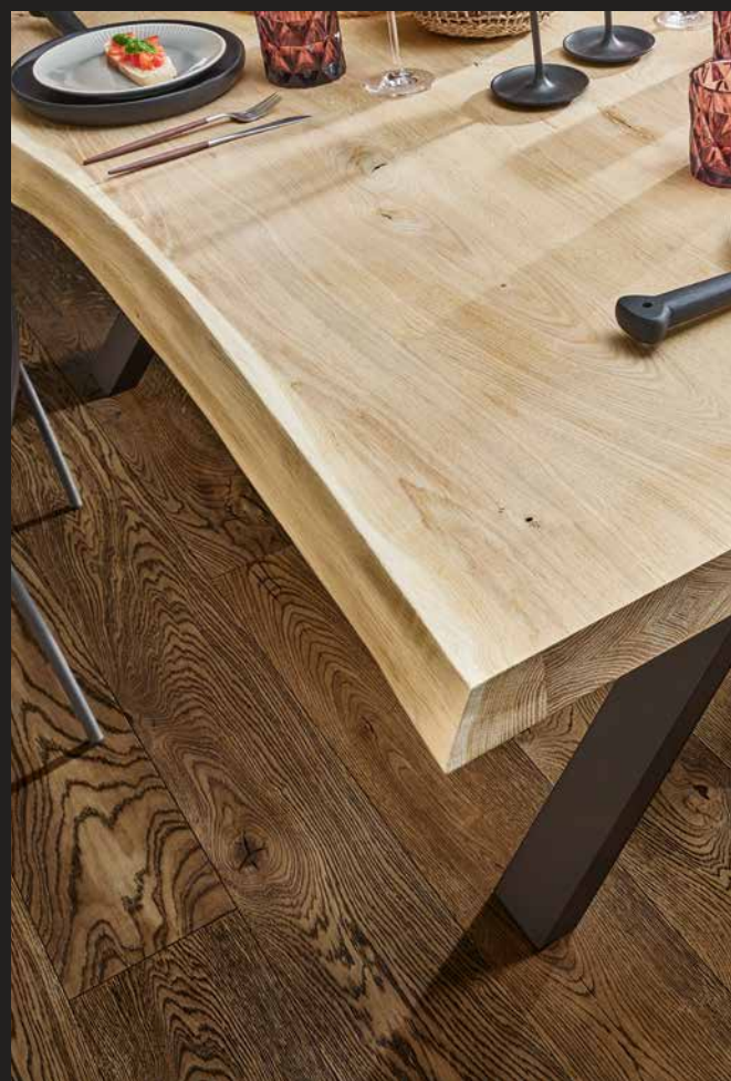
Tischplatte Eiche Modell I | Gestell Modell Metall filigran