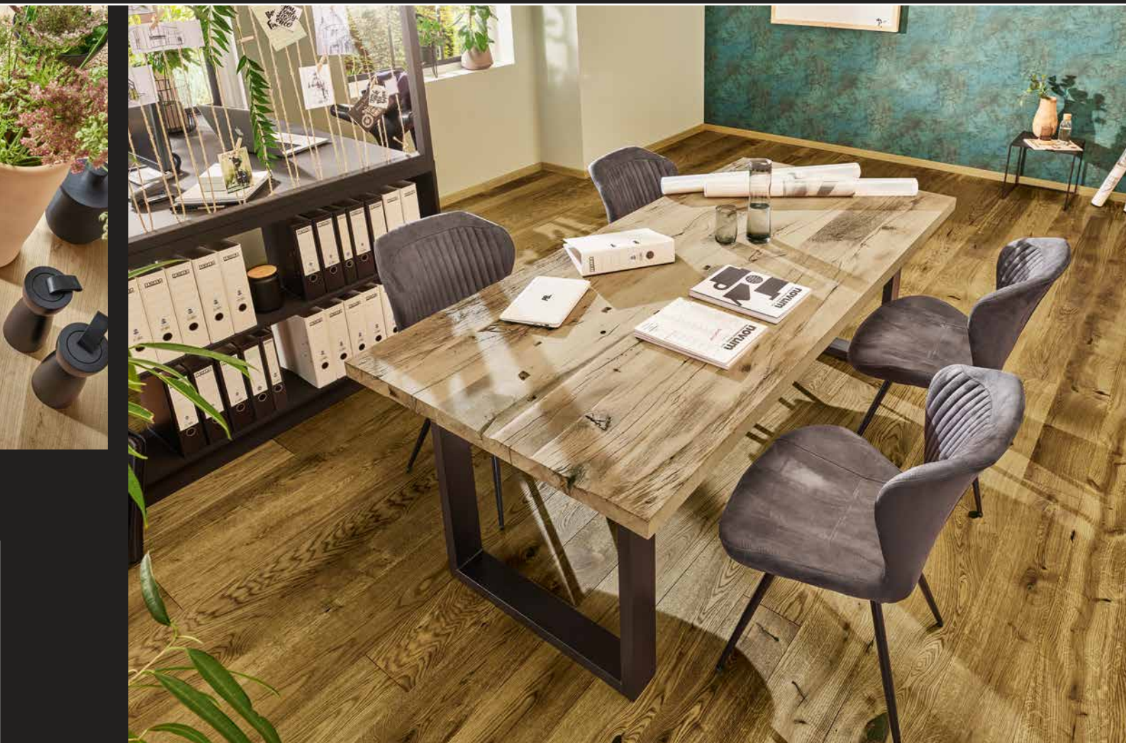
Tischplatte Eiche Modell X echtes Altholz | Gestell Modell Metall filigran U