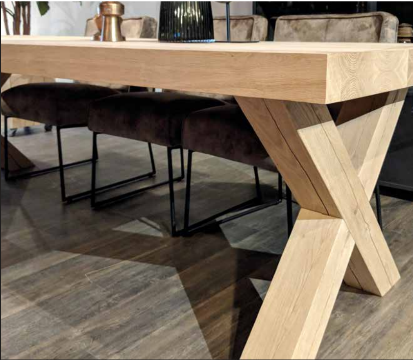
Gestell Modell Holz massiv X